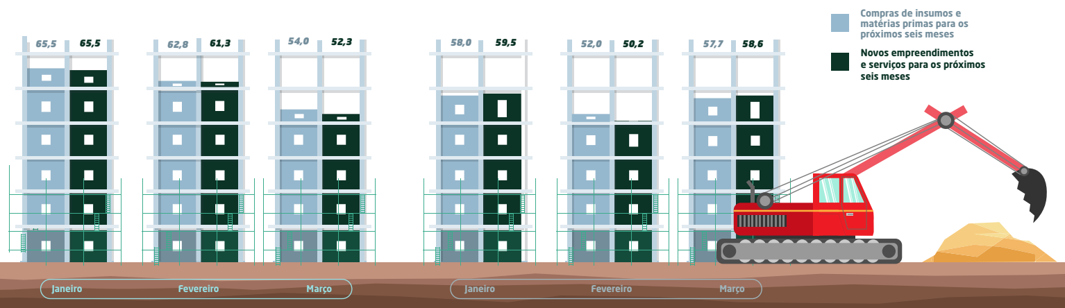
Gráfico nº 4 - Indicadores do nível de compras de insumos e novos empreendimentos para os próximos seis meses da Indústria da Construção Civil de Alagoas e Nordeste - janeiro a março de 2026