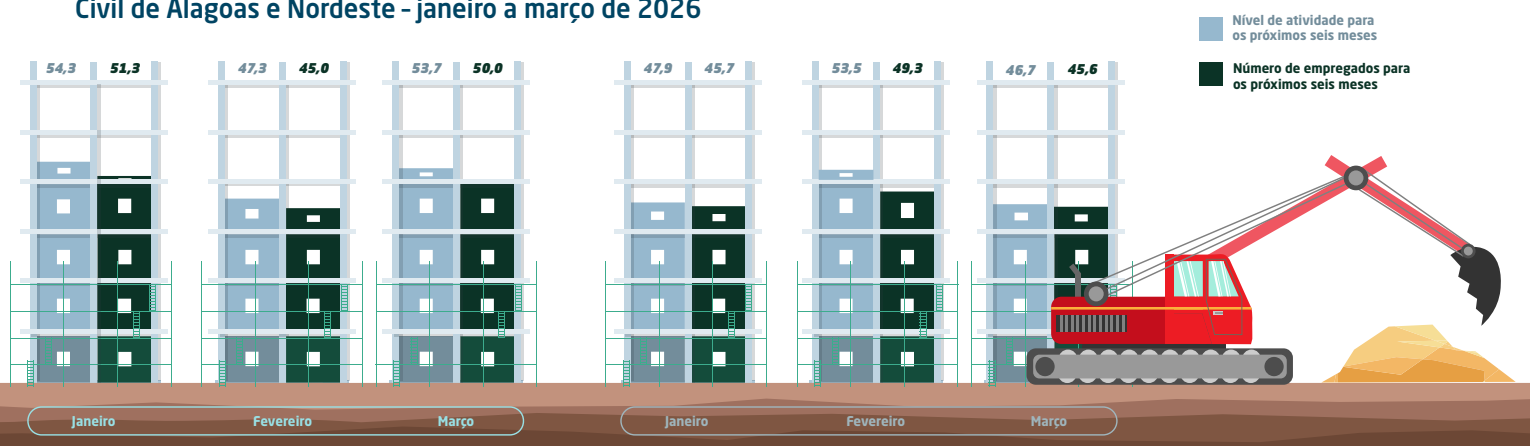
Gráfico nº 2 - Indicadores do nível de atividade e emprego em relação ao mês anterior da Indústria da Construção Civil de Alagoas e Nordeste - janeiro a março de 2026

Em síntese, os dados mostram que a indústria da construção iniciou 2026 com menor dinamismo, tanto em Alagoas quanto no Nordeste, especialmente na comparação com o trimestre anterior. Em Alagoas, o emprego seguiu em expansão, porém em ritmo mais lento. No Nordeste, tanto o mercado de trabalho quanto o nível de atividade ficaram abaixo da linha divisória, indicando desempenho mais fraco no início do ano, apesar da relativa estabilidade na comparação interanual.