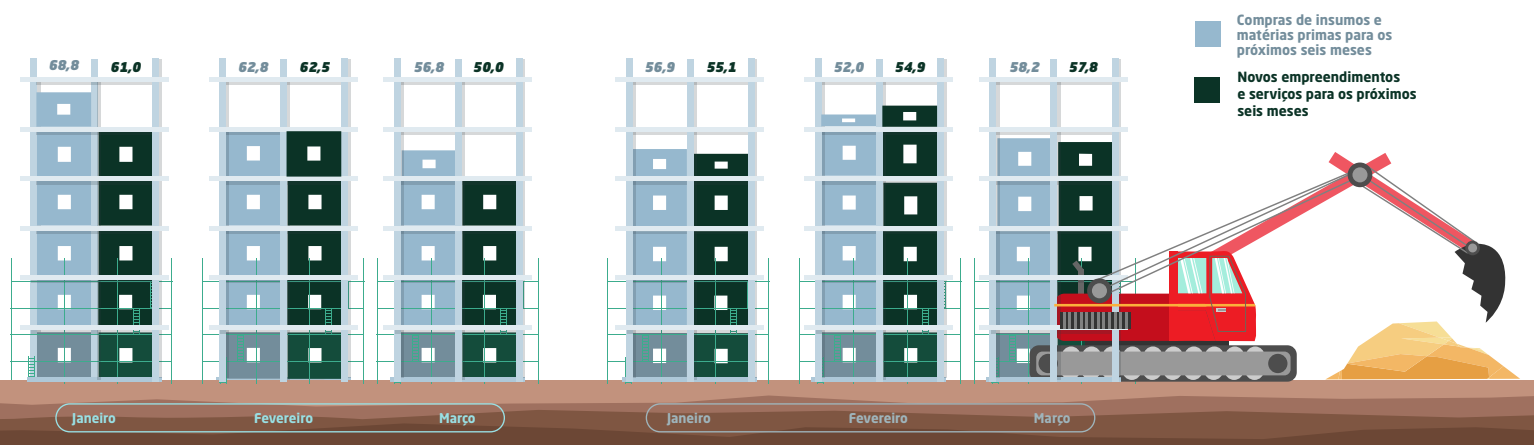
Gráfico nº 3 - Indicadores do nível de atividade e emprego para os próximos seis meses da Indústria da Construção Civil de Alagoas e Nordeste - janeiro a março de 2026

Em suma, os resultados indicam que as expectativas para a indústria da construção permaneceram positivas no início de 2026, tanto em Alagoas quanto no Nordeste. Em Alagoas, destaca-se o avanço em relação ao trimestre anterior, com elevação nos indicadores de atividade prevista, emprego, compras de insumos e novos projetos, embora parte deles ainda esteja abaixo dos níveis observados no início de 2025, especialmente emprego e insumos. No Nordeste, observa-se acomodação na margem, mas com desempenho superior ao registrado no mesmo período do ano anterior em todos os componentes, indicando manutenção de perspectivas favoráveis para os próximos meses.