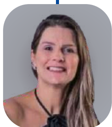
Joanna Rubim Assessoria e Consultoria Contábil